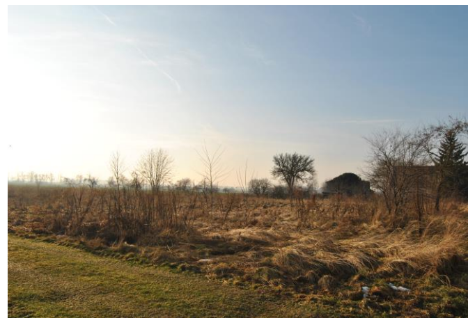
Działka pod budowę świetlicy wiejskiej