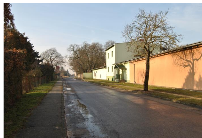
Główna droga przebiegająca przez wieś