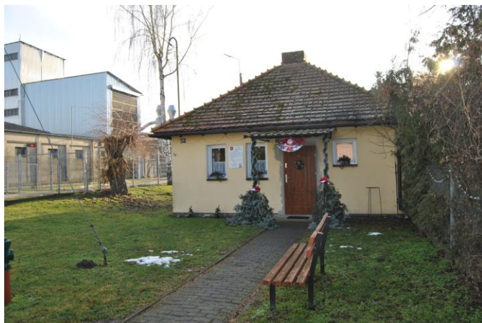
Obecna świetlica wiejska