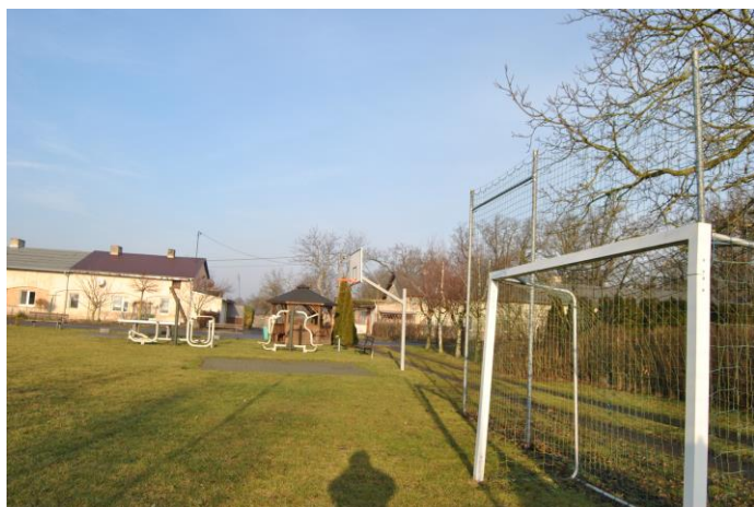
Boisko sportowe, siłownia zewnętrzna i wiata