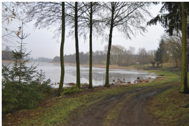
Teren nad jeziorem, gdzie ma powstać miejsce do kąpieli