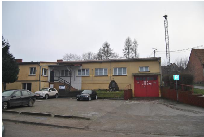
Świetlica wiejska z remizą