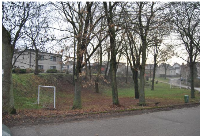
Glinki z boiskiem