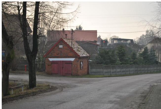
Stara remiza koło Glinek