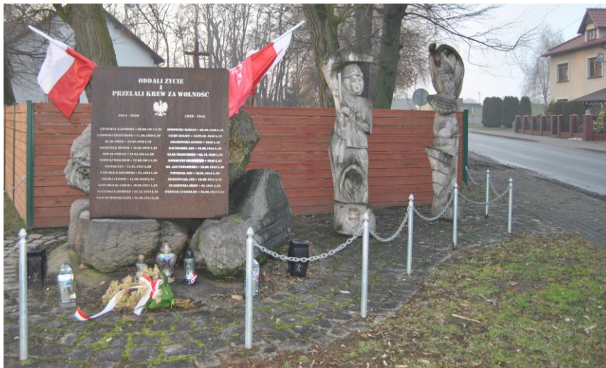
Tablica upamiętniająca mieszkańców poległych za niepodległość w latach 1914-1920 i 1939-1945.