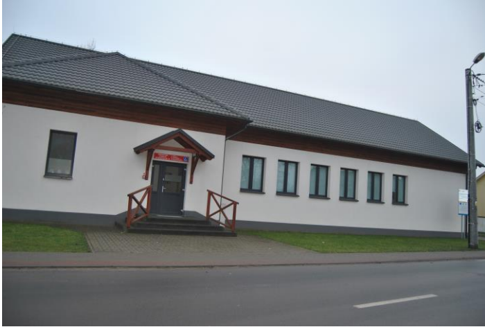
Świetlica wiejska w Łuszkowie.