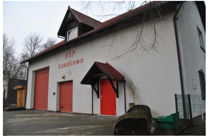
Remiza OSP w Łuszkowie