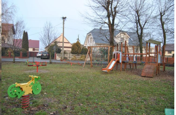
Teren rekreacyjny w centrum miejscowości: grzybek oraz plac zabaw.