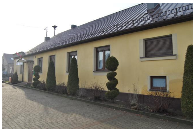
Świątelnia wiejska w Rąbinu.