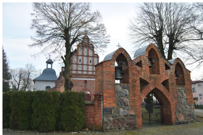
Kościół w Rąbinu.