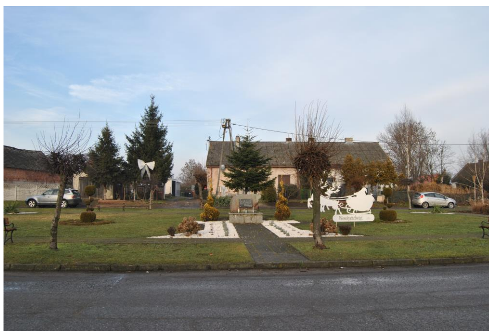
Kamień upamiętniający Insurekcję Kościuszkowską.