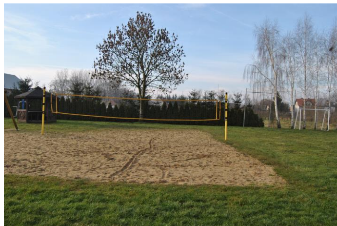
Teren rekreacyjny przy świątelnicy: plac zabaw, siłownia zewnętrzna oraz dwa boiska.